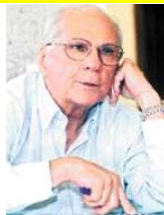
Enrique Bolaños, candidato presidencial del PLC.