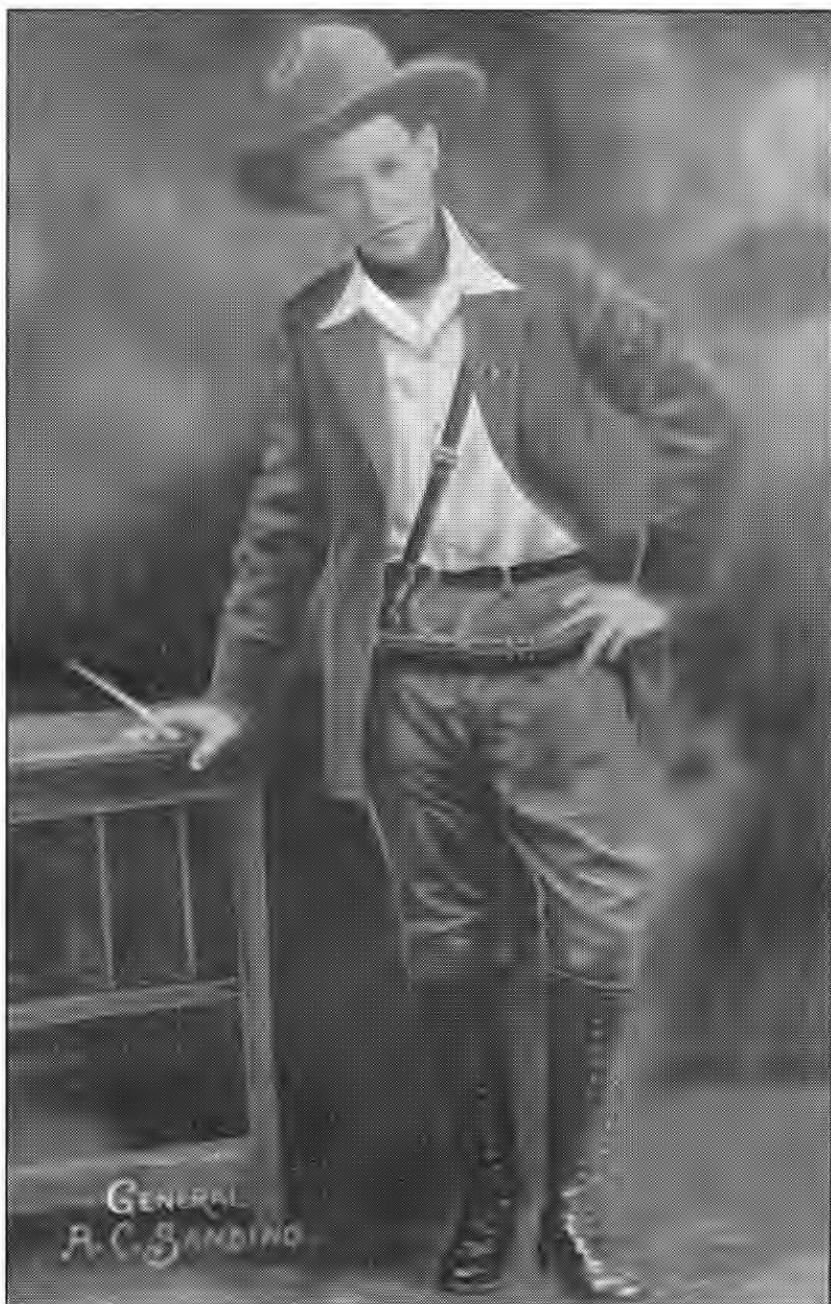
Augusto Calderón Sandino autoproclamado Augusto César Sandino