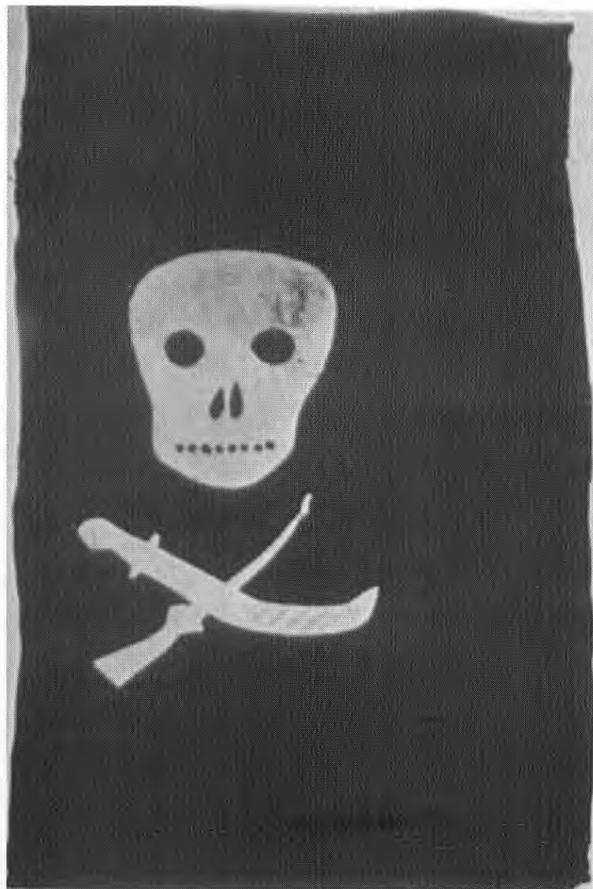
National Geographic Magazine Mayo 1932, p. 611