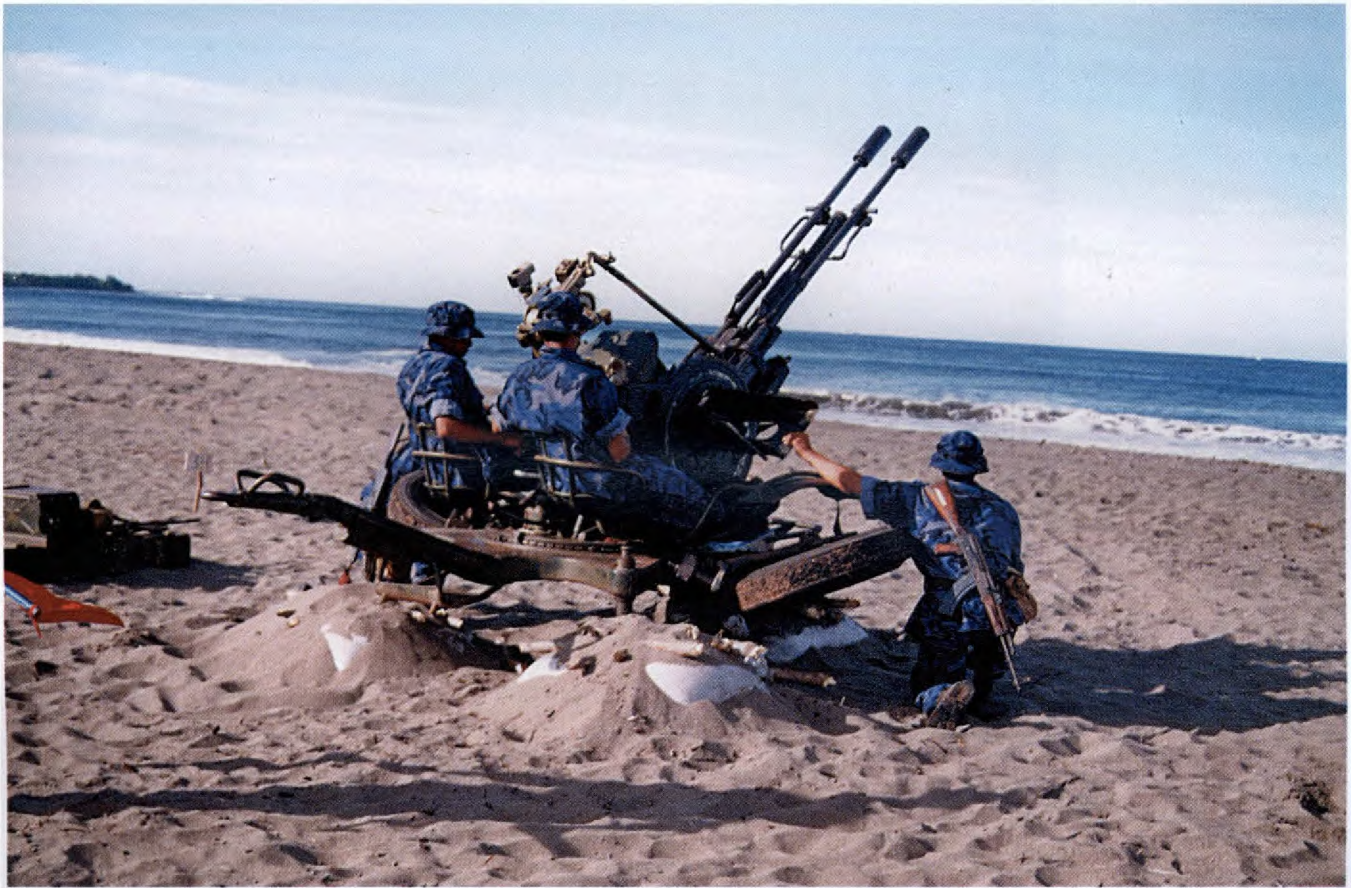
Atilería Antiaérea, Fuerza Naval.