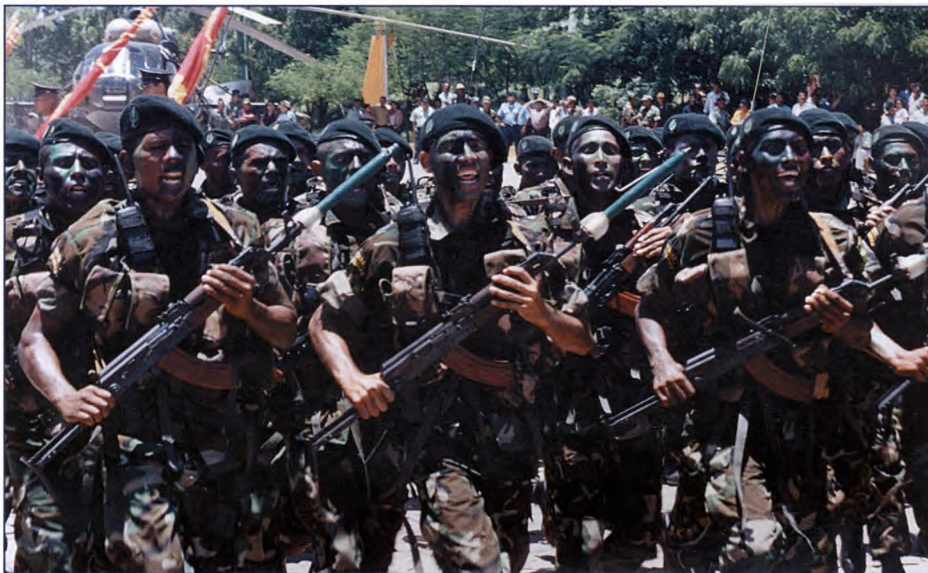
Comando de Operaciones Especiales (Foto: DRPE).